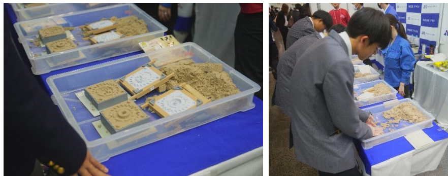
砂込め体験の様子

アキオカは砂型鑄造を行っており、砂込め体験ではキネティックサンドを使用して金属を流し込むための型作りを体験していただきました。参加者の皆さんは、型枠に砂を丁寧に詰め込みながら、慎重に作業することでよりきれいな型ができることを実感している様子でした。一方で、慎重すぎると実際の現場では生産に間に合わないのも、適度なスピードも大切だということを実感していただきました。また型枠を外した瞬間には、枠の形状がきれいに転写された砂型を見て思わず「わあ！」と驚きの声上がるなど、楽しみながら鑄造の仕組みに触れていただく場となりました。